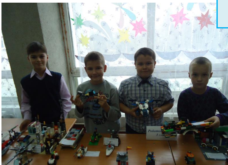
Работы обучающихся по направлению «Робототехника»