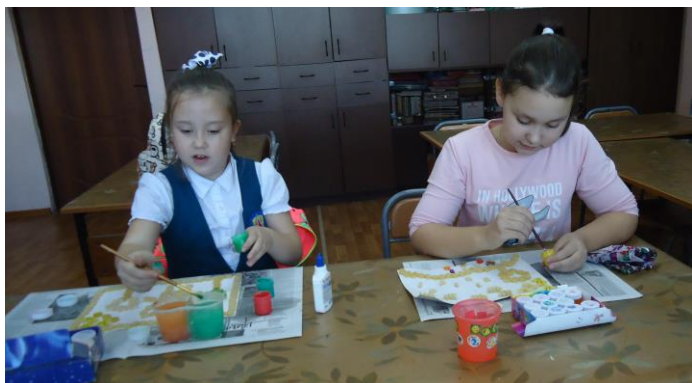
Подготовка к выставке «Первые шаги»