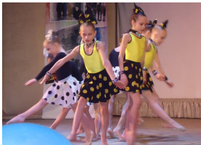
Выступление обучающихся по направлению «Художественная гимнастика»