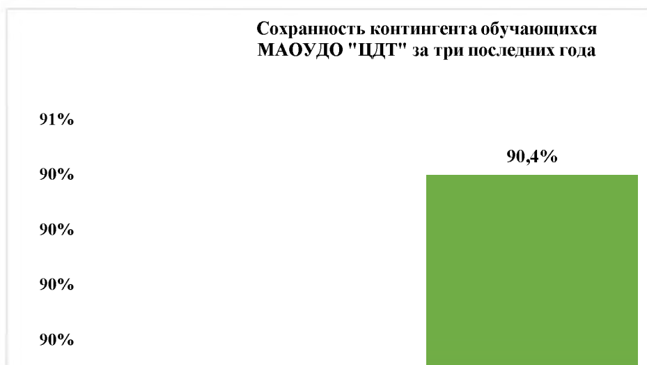
Сравнительная таблица сохранность контингента обучающихся в студиях и клубах по годам обучения за 2019-2022г.г.

Сохранность контингента обучающихся по МАОУДО «ЦДТ в 2019 году составляла 89%, в 2020 году - 90%, в 2021 году – 90,4%, в 2022 году – 90,0%